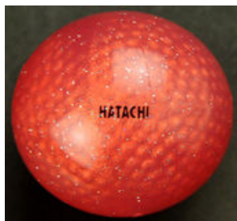
ハタチクリスタルミラー