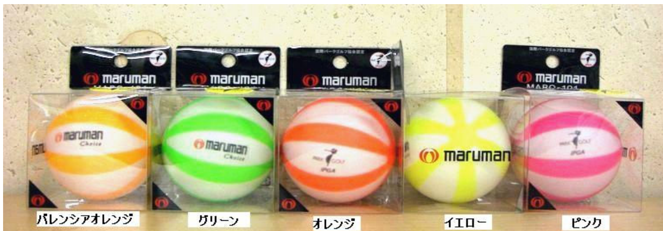
バレンシアオレンジ