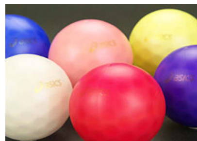
アシックスパワーディンプル