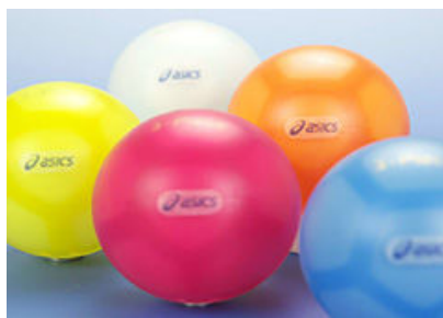
アシックスインナーバンド