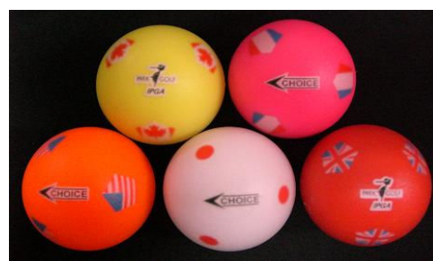
カルチヨ国旗ボール