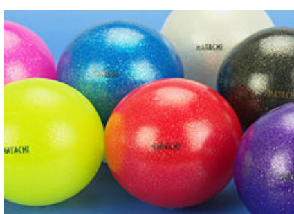
ハタチクリスタルクロス