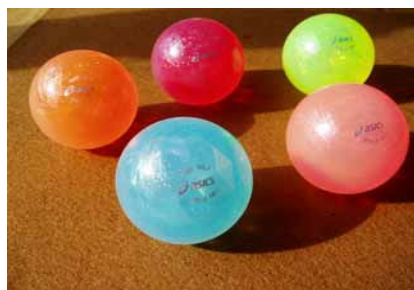
アシックスアポロボール II